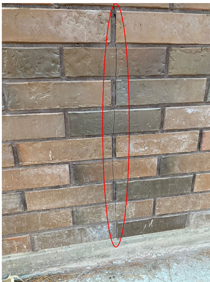
Температурно – усадочная трещина в кирпичной кладке

При отсутствии вертикальных деформационных швов в лицевой кладке такое удлинение стены может привести к образованию вертикальных температурно – усадочных трещин и выдавливанию кирпича за плоскость стены.